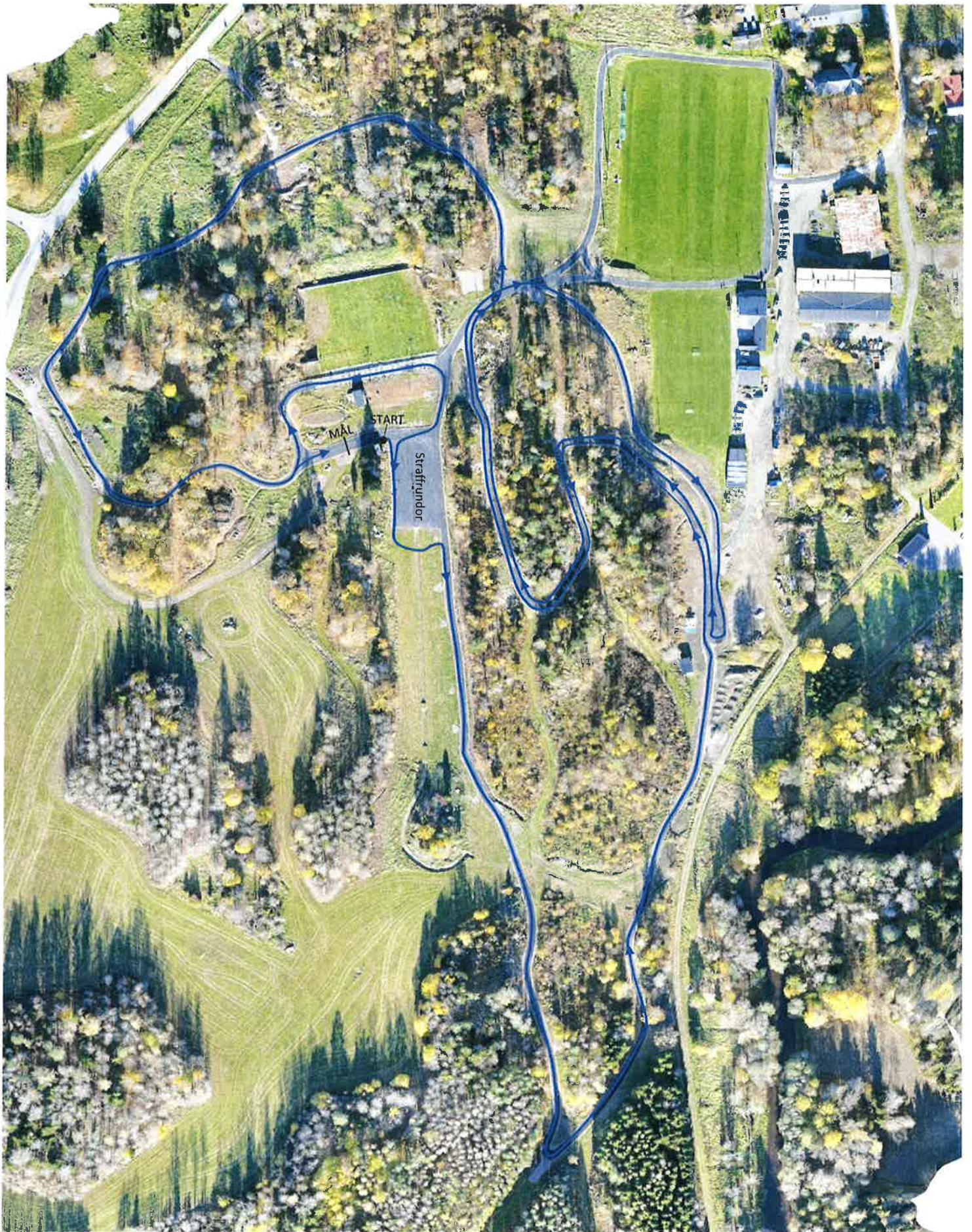
H 16-19 Och D Seniorer 7,5 Km (3x2,5 Km)